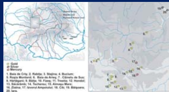
Залежи на злато, сребро и живак в Дакия

златните мини. Докато в предримско време дакийското злато се е добивало предимно чрез промиване на златоносните пясъци, то римляните започват да разработват открити рудници. Част от изградените от римляните хоризонтални галерии са запазени и до днес.