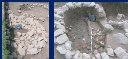
Гробовете с кремация с каменен кръг в Tăul Cornii (RO)