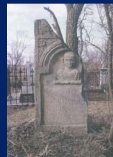
Надгробна плоча в Tarina (RO)